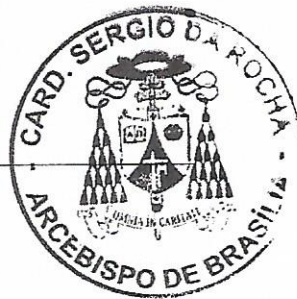
Card. Sergio da Rocha Arcebispo Metropolitano de Brasília